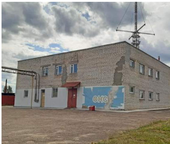
ФОТО ОБЪЕКТА СНАРУЖИ